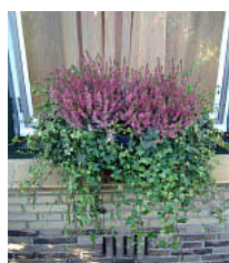
Hedera en Erica

Bloembollen in verschillende lagen om een rijkere of opeenvolgende bloei te krijgen. Colchium, Chionodoxa, Anemone blanda, Crocus Thomassianus "Ruby Giant", (10 cm hoog), Iris danfordiae, Narcissus 'Topolino', 'Peeping Tom' of 'Tête à Tête', mini wilde tulp 'Little Beauty', Tulipa Linifolia.