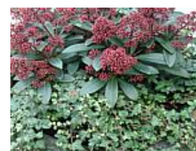
Hedera en Skimmia

Ook wintergroen zijn dwergmispels zoals Cotoneaster microphyllus en de lage kardinaalshoed (Euonymus fortunei).