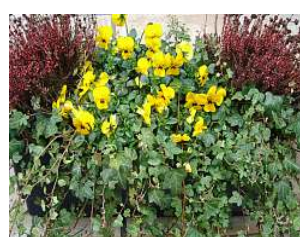
Hedera, Erica en miniviolen