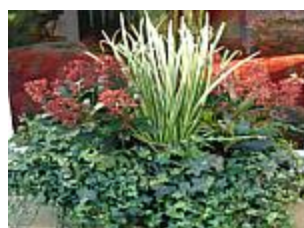
Hedera, Skimmia en siergras